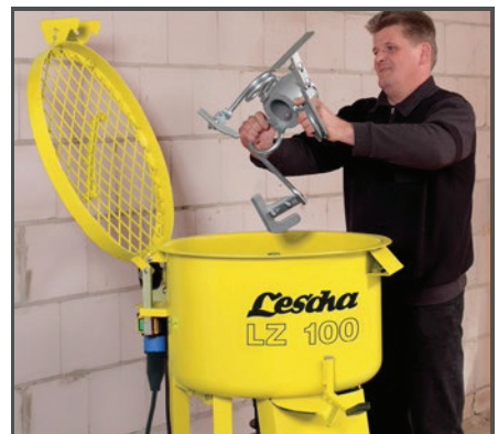
Jednoduchá demontáž míchacích ramen bez použití nářadí umožňuje snadné a rychlé čištění míchacích ramen i bubny.