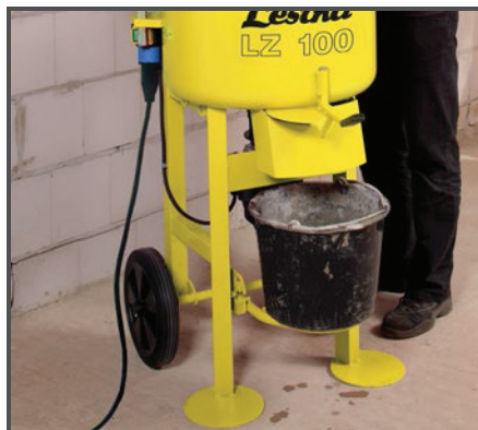
Sklopný držák umožňuje přímé vysypávání namíchaného materiálu např. do kbelíku nebo kolečka.