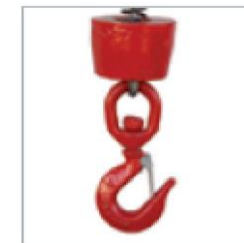
Gancho de seguridad